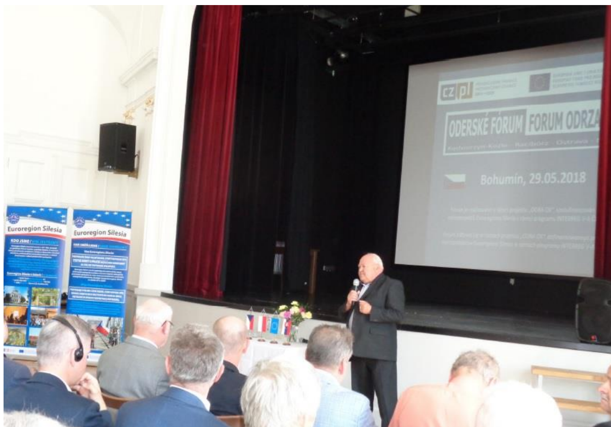
Z Oderského fóra

Všechny informace byly poté prezentovány na akci nazvané Oderské fórum. Ta se odehrála v Bohumíně, přítomno bylo přes 120 účastníků. Na fóru vystoupili i experti, kteří zpracovávali jednotlivé kapitoly studie. Celá akce se odehrála pod záštitou příslušných ministrů jak z ČR, tak z Polska.