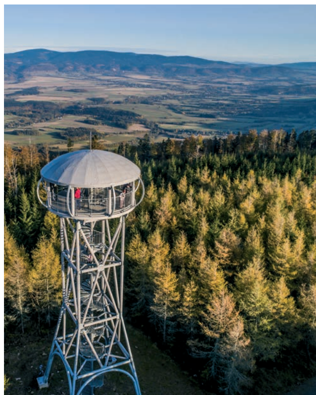
Wieża widokowa w Jagodnej w okolicach Bystrzycy Kłodzkiej.