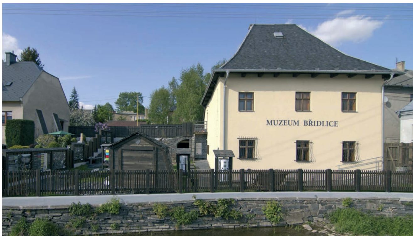
Muzeum Łupka w Budišovie nad Budišovkou.