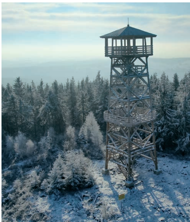
Wieża widokowa na Czerńcu niedaleko Międzyzlesia.