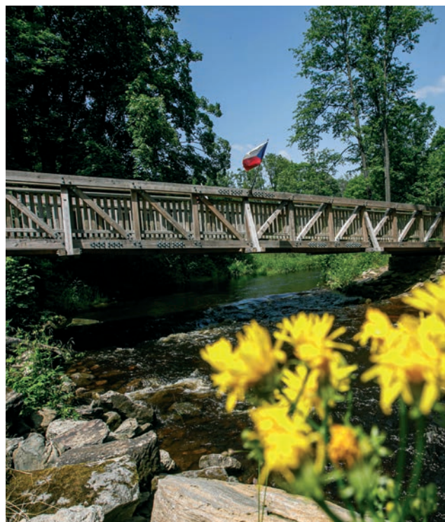
Most w Neratovie, który łączy czeski i polski brzeg rzeki Divoká Orlice.