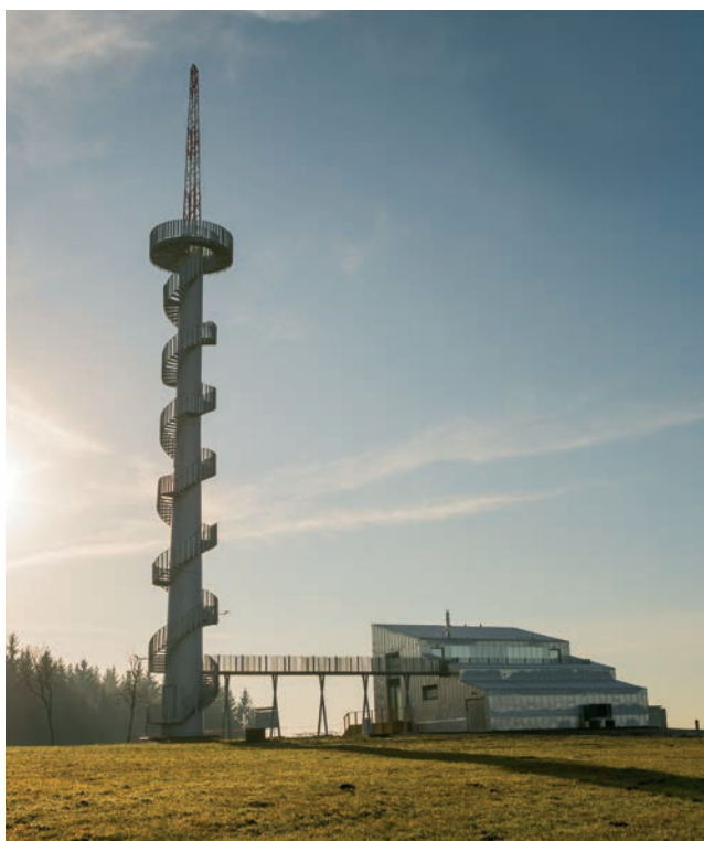
Wieża widokowa na wzgórzu Šibeník w Nowym Hradku jest pierwszą w Czechach wieżą widokową, która powstała z przebudowanej elektrowni wiatrowej.