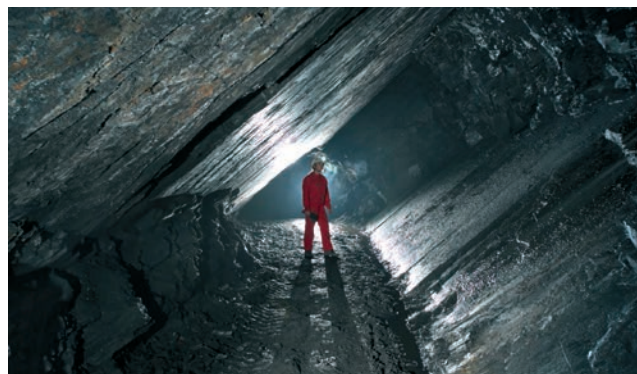
Korytarz kopalni Flaschar w miejscowości Nový Svět koło Oder.

Mgr. Alena Zemanová Krajina břidlice, z.s. www.krajinabridlice.cz