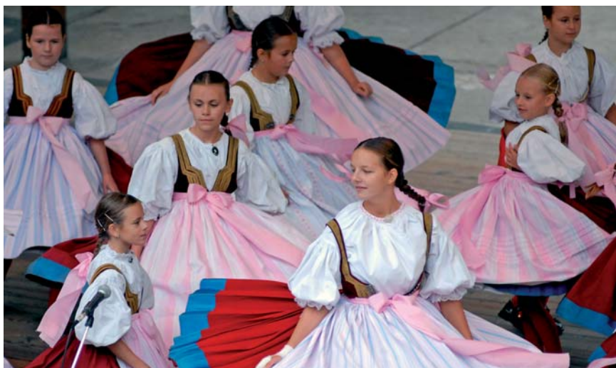
Dziecięcy zespół folklorystyczny Slezanek regularnie uczestniczy w międzynarodowym festiwalu „Dni Śląskie”, który Macierz Śląska organizuje co roku we wrześniu na terenie swojego ośrodka ludoznawczego w Dolnej Łomnej (w Euroregionie Śląsk Cieszyński).