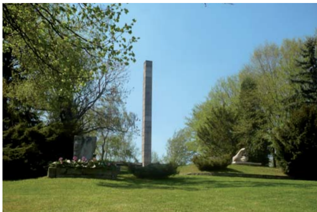
Jednym z ważnych miejsc na terenie Mikroregionu Macierz Śląska jest Ostrá hůrka z pomnikiem Śląskiego Ruchu Oporu. W XIX i XX wieku odbywały się tu historyczne zgromadzenia śląskiej ludności. Również dzisiaj wzgórze to jest miejscem spotkań mieszkańców z okazji ważnych wydarzeń czeskiego Śląska.

Od 1990 roku Ostrá hůrka jest miejscem spotkań mieszkańców z okazji ważnych wydarzeń czeskiego Śląska. W maju 1998 roku odbyło się tu spotkanie z okazji 80. rocznicy zjazdu ludu, który odbył się w 1918 roku. Elementem tego spotkania było także ogłoszenie zamiaru powołania Euroregionu Silesia. Mikroregion Macierz Śląska został członkiem euroregionu wkrótce po swoim założeniu, a jego przedstawiciela wybrano do węższego kierownictwa czeskiej części euroregionu. Mikro-