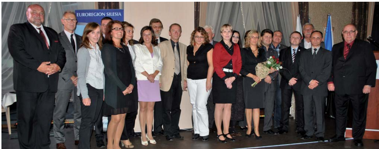
Z okazji 15-lecia Euroregionu Silesia przyjechali złożyć życzenia także przedstawiciele wszystkich innych euroregionów z polsko-czeskiego pogranicza