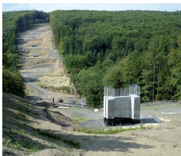
W Mikroregionie Macierz Śląska realizowany jest obecnie jeden z najważniejszych projektów ostatnich czasów – budowa nowej czteropasmowej drogi między Opawą i Ostrawą, która należy do głównej sieci komunikacyjnej nie tylko Euroregionu Silesia, ale całego kraju morawsko-śląskiego. Ta nowa droga łącząca dwa największe miasta euroregionu powinna zostać zakończona w 2015 roku.

region jest również członkiem Lokalnej Grupy Działania Opawsko, a od 2012 roku również Narodowej Sieci Zdrowych Miast.